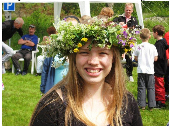
Midsommarfirande i Hornberga 2011

Kom med i sommar. Och du – ta med dina kompisar. Alla är välkomna till Hamregården!