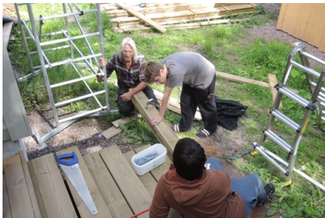
Ett av sommarens stora byggprojekt: upprustning av fyrstugans veranda