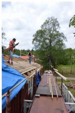
Renovering av Andersstugans tak. traditionella grillsmaken och