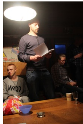
Uppläsning ur "Våra liv med Hamregården" i gillestugan.