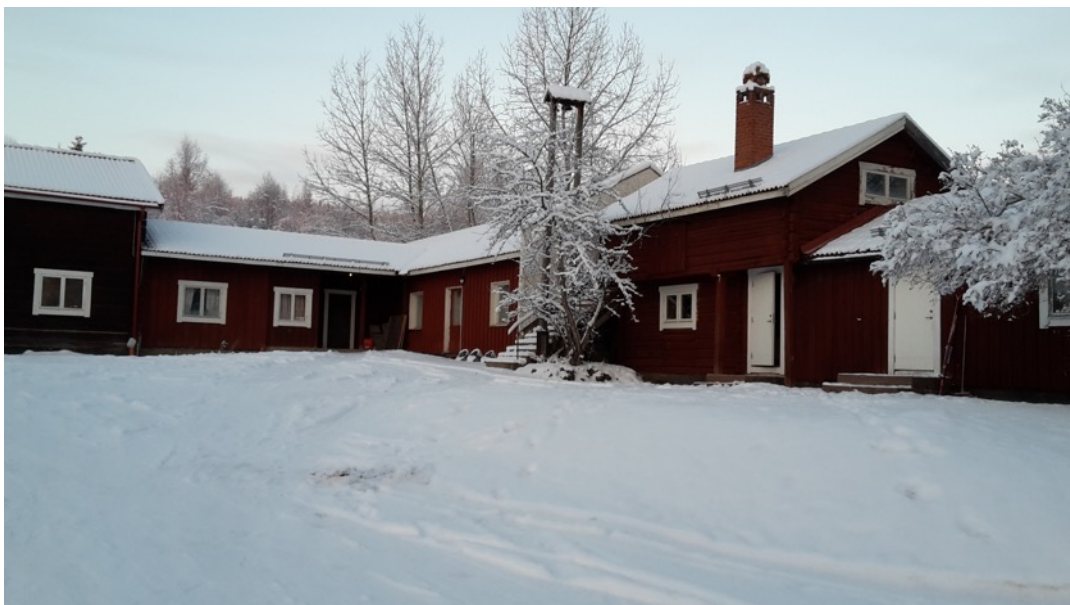
Hamregården med en massa härlig snö.

Vi ses på Hamre på jullovet och på sportlovet!